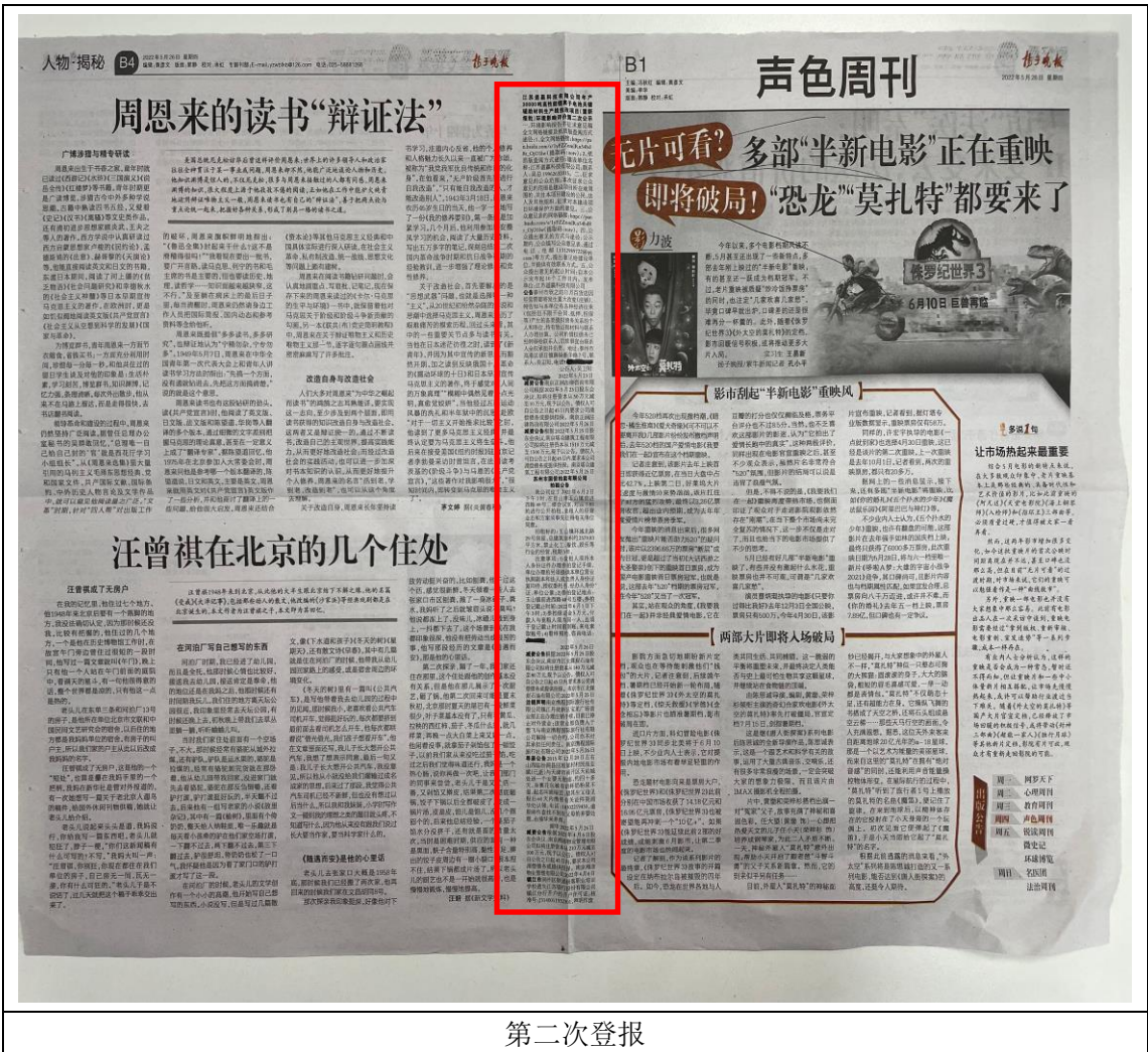
第二次登报 图 3-2 登报照片