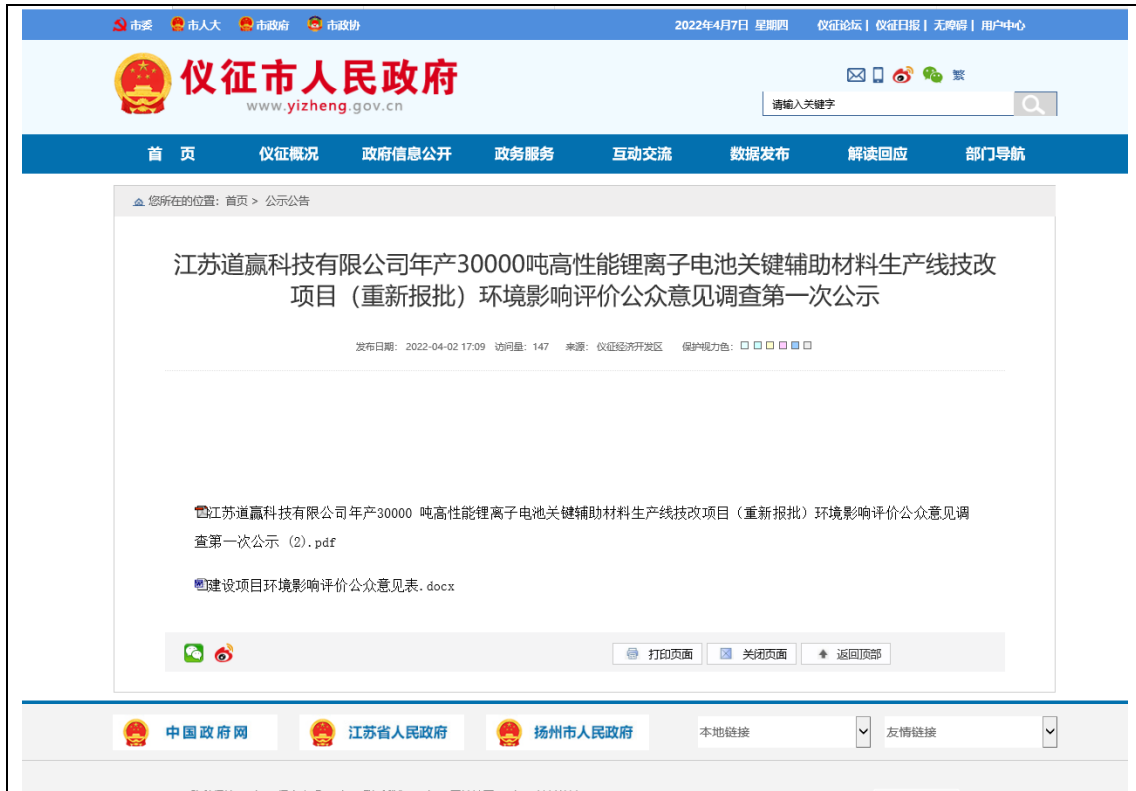
图 2-1 首次环境影响评价信息公开截图